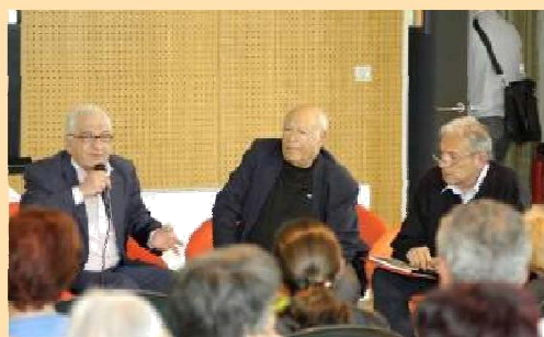
Παρέμβαση 3 ιστορικών