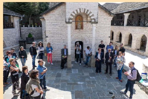
Επίσκεψη στη Μονή Τσούκας

Η ημέρα πεζοπορίας –φωτογραφικό σαφάρι που οργάνωσε ο Δήμος Βορείων Τζουμέρκων το Σάββατο 9 Μαΐου 2015 είχε μεγάλη επιτυχία και έτυχε και της παρουσίας του υφυπουργού πολιτισμού του Κου Ξυδάκη. Πάνω από 65 άτομα μεταξύ των οποίων και πολλά παιδιά, συμμετείχαν στην πεζοπορία από τη Μονή Τσούκας ως το Μουσείο Σύγχρονης Τέχνης «Θ. Παπαγιάννης», στο χωριό Ελληνικό.