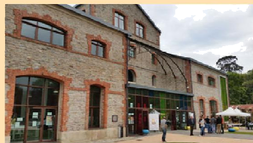
Μεντιαθήκη της Castagniccia

Η ημέρα ολοκληρώθηκε με τη βράβευση των νικητών του παιχνιδιού ανακάλυψης