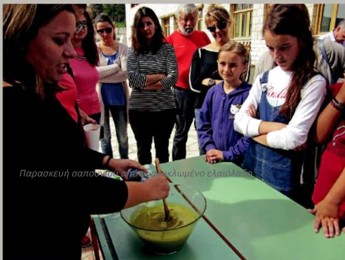
Παρασκευή σαπουνιού από ανακυκλωμένο ελαιόλαδο