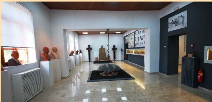
Το μουσείο Παπαγιάννη στο Ελληνικό

Στοχεύουμε στην υλοποίηση δράσεων προκειμένου να δημιουργηθεί μία μόνιμη ευρωπαϊκή πλατφόρμα, χάρη στην οποία, οι πολίτες θα μπορούν να επισκεφθούν και να πειραματιστούν με αειφορικό τρόπο, την εθνολογική κληρονομιά των αγροτικών περιοχών, με την βοήθεια νέων επαγγελματιών του πολιτιστικού τομέα.