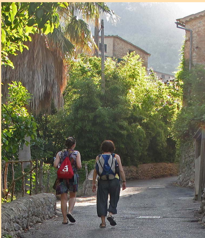
Το μονοπάτι Cami des Clot στην Deià (Μαγιόρκα)