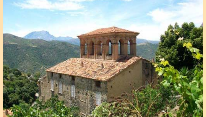
Το χωριό Lama (Κορσική)