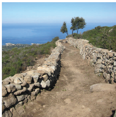
Le sentier d'Occi (Corse)

En même temps aura lieu le premier des Échanges Créatifs prévus, qui portera sur le « sons des territoires », et réunira artistes et autres acteurs liés au patrimoine immatériel sonore.