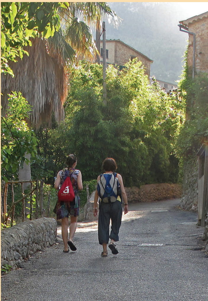
Le chemin Camí des Clot à Deià (Majorque)