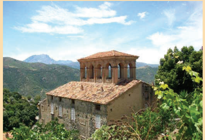
Le village de Lama (Corse)