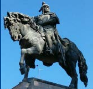
El rei En Jaume d'Alaró.

Ja als afores del poble transitam amb precaució per la carretera Ma-2100, fins al punt conegut com la Sort, on veim un camí a mà esquerra que es dirigeix al castell d'Alaró.